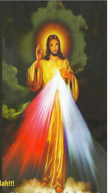
St Yohanes Paulus II