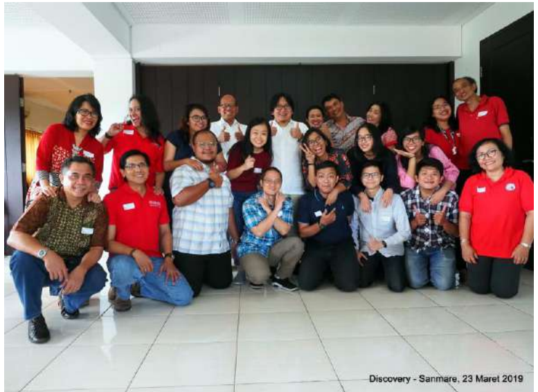
Discovery - Sanmare, 23 Maret 2019